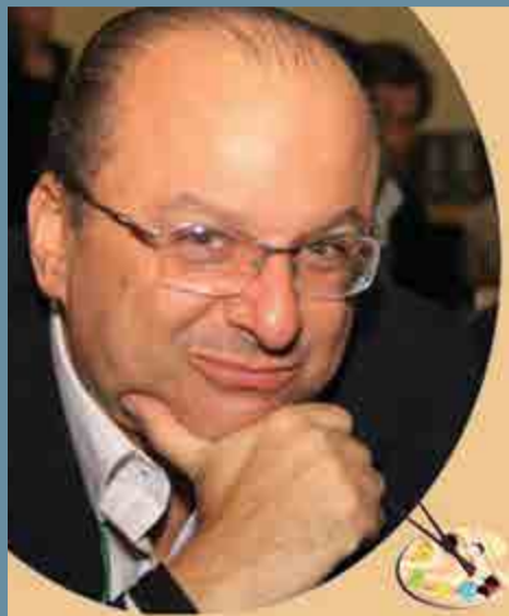
Por Ovadia Saadia