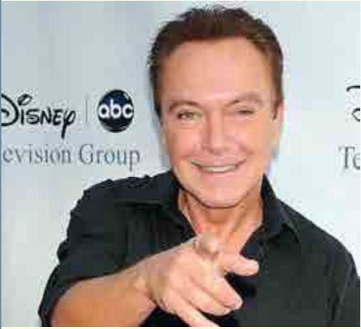
David Cassidy, o maior ídolo teen americano dos anos 70 nos deixou no mês passado melancolicamente aos 65 anos. Vida de artista!